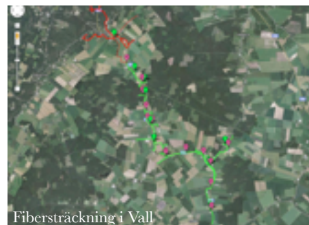
Fibersträckning i Vall