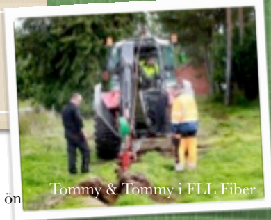
Tommy & Tommy i FLL Fiber

I takt med att allt fler socknar får fiber utbyggt öppnas också möjligheter för nya lokala etableringar. Under slutet av året har de första frågorna kommit från företagare om möjligheter att få snabbare "upplänkar" där TeliaSonera idag kan erbjuda Gotland 100 Mb med garanterat 50Mb upp för ca 350 kr per månad.