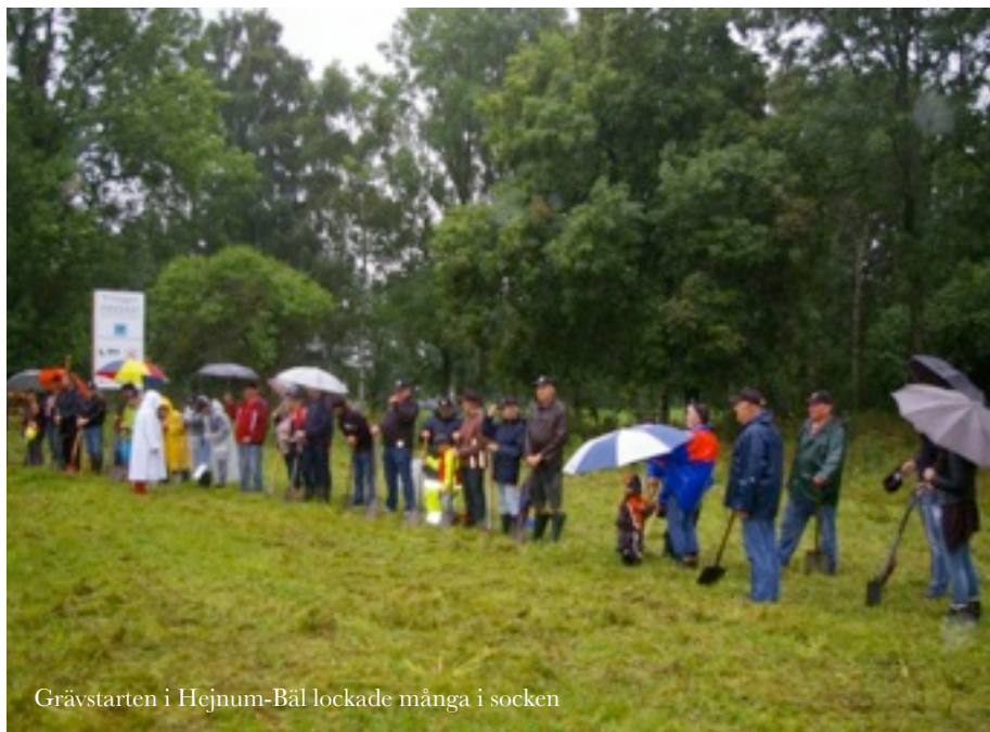
Grävstarten i Hejnum-Bäl lockade många i socken