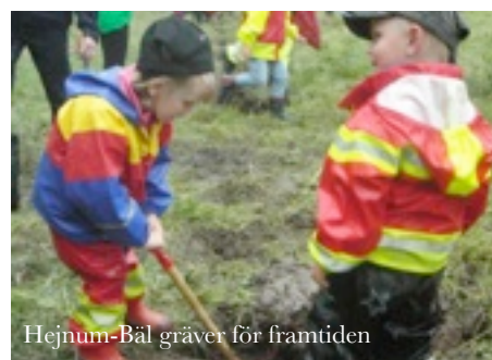
Hejnum-Bäl gräver för framtiden